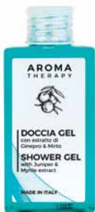
DOCCIA GEL Estratto di Ginepro e Mirto DUSCHGEL Wacholder und Myrte Extrakt 50 ml AT50DG