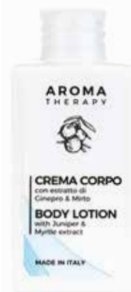
CREMA CORPO Estratto di Ginepro e Mirto KÖRPERCREME Wacholder und Myrte Extrakt 50 ml AT50BL