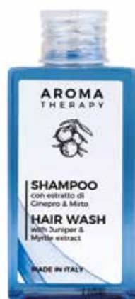
SHAMPOO Estratto di Ginepro e Mirto HAARSHAMPOO Wacholder und Myrte Extrakt 50 ml AT50SB