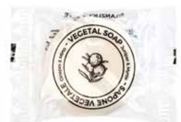
SAPONE MASSAGGIO VEGETALE Fragranza Ginepro e Mirto PFLANZLICHE MASSAGESEIFE Wacholder und Myrte Duft 20 g AT20