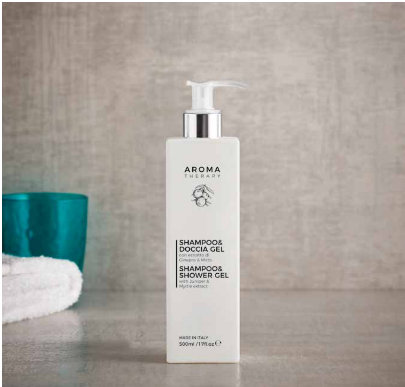
Dispenser dotato di indicatore livello del liquido interno. Seifenspender mit internem Flüssigkeitsindikator.