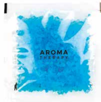
SALI BAGNO Fragranza Lavanda BADESALZ Lavandel Duft 30 gr AT30SB