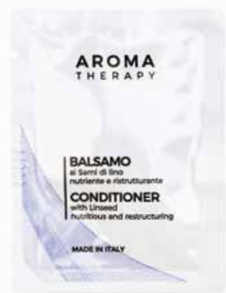
BALSAMO Fragranza Semi di Lino HAARBALSAM Leinsamen Extrakt 5 ml AT5CO