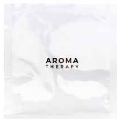
IGIENE INTIMA Fragranza delicata INTIMPFLEGE Sanfte Formel 5 ml AT5II