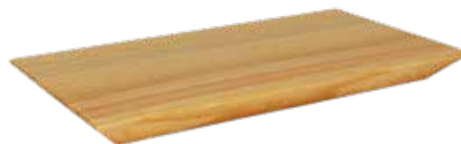
In legno naturale Aus naturfarbenem Holz PL6613N