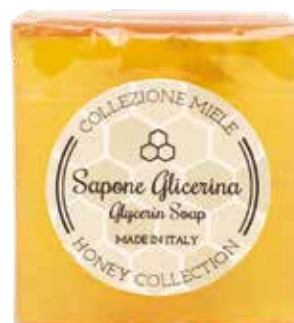
SAPONE ALLA GLICERINA Jardin Fleuri GLYCERINSEIFE Jardin Fleuri 20 g MLE20G