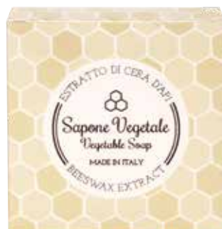
SAPONE VEGETALE Miele e camomilla PFLANZLICHE SEIFE Honig und Kamille 20 g MLE20