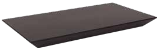
In legno verniciato nero Aus schwarzem Holz PL6613