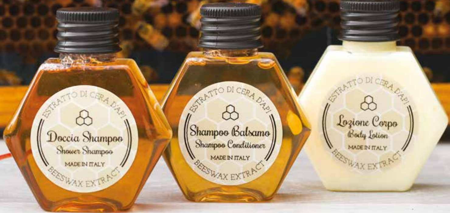
DOCCIA SHAMPOO Miele e zenzero DUSCHGEL Honig und Ingwer 35 ml MLE35DS