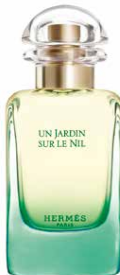
Eau de Toilette 50 ml 22856