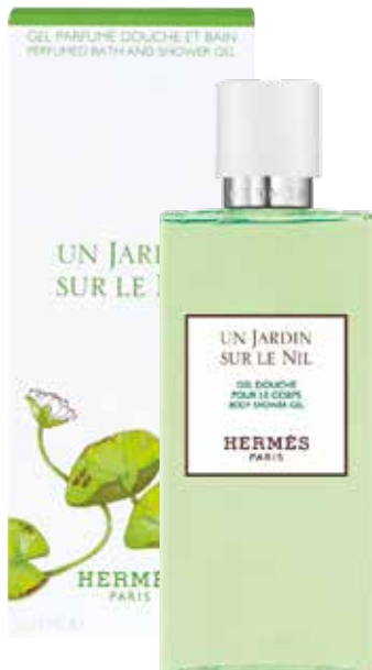
Gel doccia Duschgel 200 ml 22053