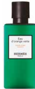
Shampoo Haarshampoo 80 ml 6632180 40 ml 6632140