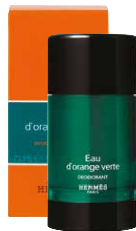
Deodorante stick Deodorant Stick 75 ml 24733