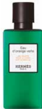
Gel detergente Duschgel 80 ml 6632480 40 ml 6632440