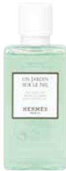
Gel Doccia e Bagno Bade- und Duschgel 80 ml 2682180 40 ml 26821