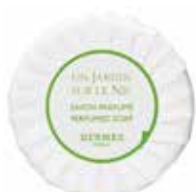
Sapone Seife 50 g 28722 25 g 28721