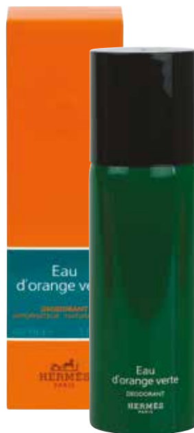
Deodorante spray Deodorant Spray 150 ml 27634