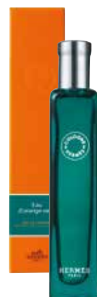
Spray Nomad 15 ml 24753