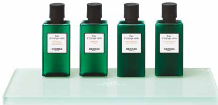
Espositore in plexiglass trasparente Ablage aus transparentem Plexiglas 25 x 12 x 1 cm 65668H