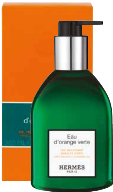
Gel detergente mani e corpo Reinigungsgel für Hände und Körper 300 ml 24738