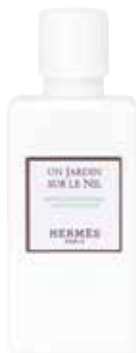
Balsamo Haarbalsam 80 ml 2682380 40 ml 26823