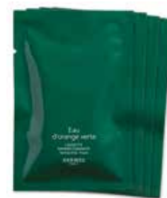
Salvietina rinfrescante Erfrischungstuch Eau de Cologne 8 ml 24747