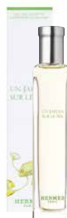
Profumo Spray Nomad Parfüm Nomad 15 ml 22842