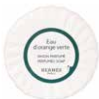
Sapone Seife 50 g 6632050N 25 g 6632025N