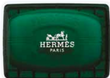
Sapone in cofanetto di plastica Seife in Plastikbox 150 g 27928 100 g 66320100