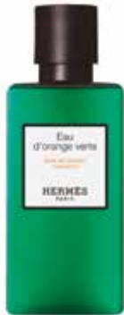
Bagnoschiuma Badeschaum 80 ml 6632280 40 ml 6632240