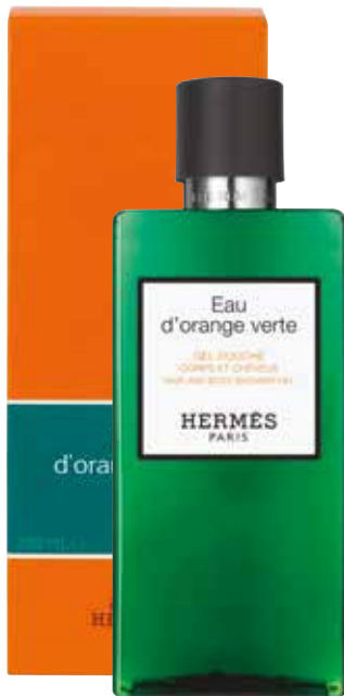
Shampoo doccia Shampoo und Duschgel 200 ml 24731