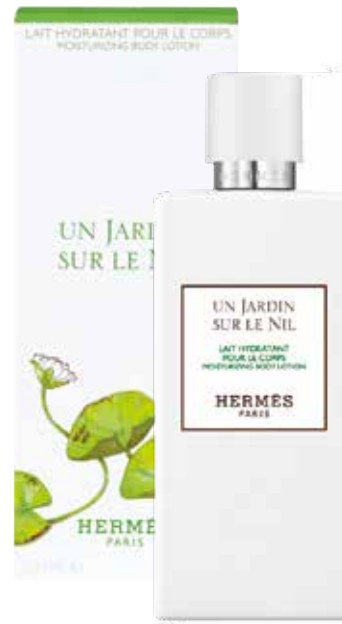
Lozione corpo Körperlotion 200 ml 22051