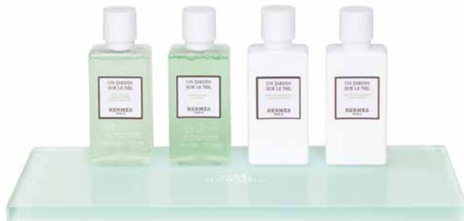
Espositore in plexiglass trasparente Ablage aus transparentem Plexiglas 25 x 12 x 1 cm 65668H