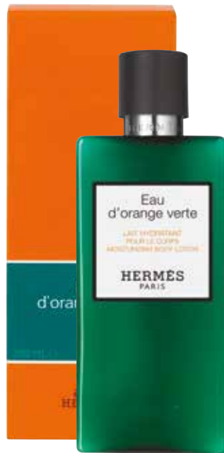
Crema corpo idratante Feuchtigkeit Körpercreme 200 ml 24737