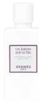
Crema Corpo Körpercreme 80 ml 2682080 40 ml 26820