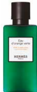
Balsamo Haarbalsam 80 ml 6632580 40 ml 6632540