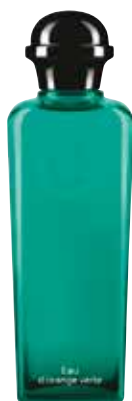
Eau de Cologne 30 ml 6632430 50 ml 6632450