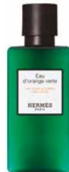
Crema corpo Körpercreme 80 ml 6632380 40 ml 6632340