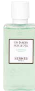
Shampoo Haarshampoo 80 ml 2682280 40 ml 26822