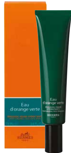
Emulsione viso idratante Gesichtsfeuchtigkeitsemulsion 75 ml 24734