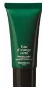
Crema viso Gesichtscreme 15 ml 25694